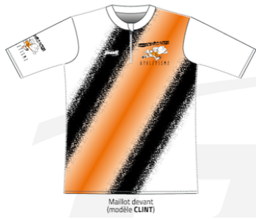
Maillot devant (modèle CLINT)